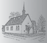
St. Anna Hausweiler