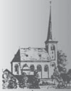
Heilig Kreuz Vernich