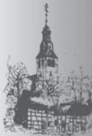
St. Mauritius Weilerswist