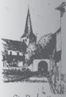
St. Pankratius Lommersum