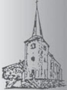
St. Johannes d. Täufer Metternich