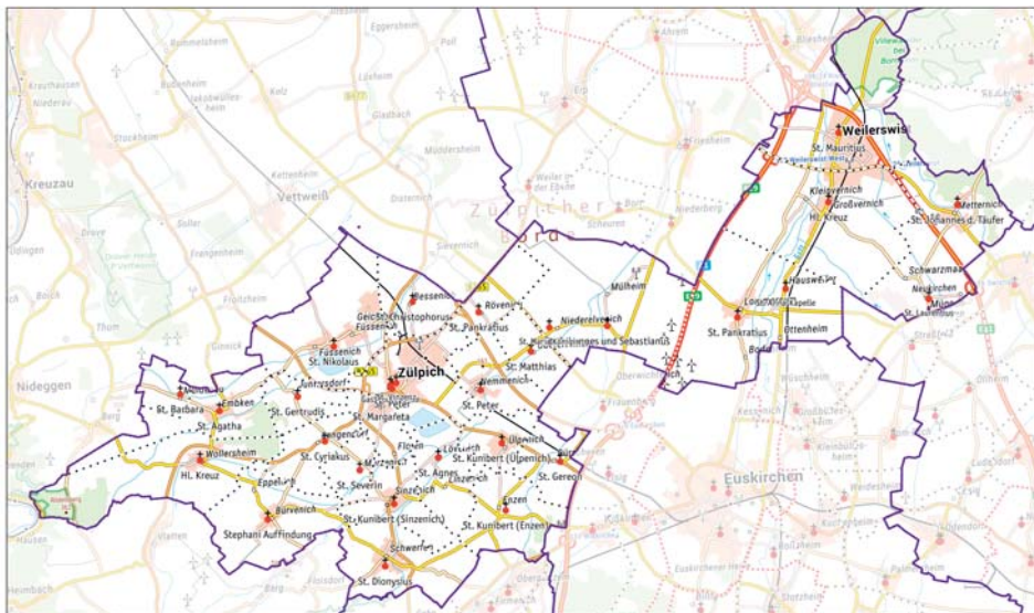
Vorschlag Pastoralie Einheits Weilerswist + Zulpich Katholikenzahl (Stand 2021): 21.244